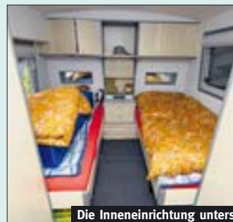
Die Inneneinrichtung unterscheidet sich kaum von einem fixen Heim.

Beruf. Wir fahren oft an Oldtimer-Treffen, auch nach Deutschland an ein Selbstausbauer-Meeting. Da treffen sich dann über tausend Einheiten aus ganz Europa. Seit 15 Jahren verbringen wir regelmässig unsere Ferien in Südfrankreich. Es macht mir nichts aus, den neugierigen Gästen auf den Campingplätzen einen Blick ins Innere des Busses werfen zu lassen.»