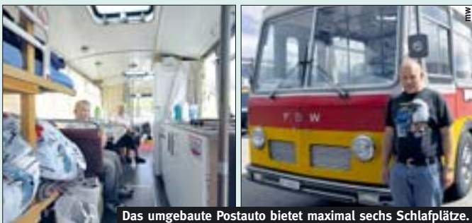
Das umgebaute Postauto bietet maximal sechs Schlafplätze.

wir in die Ferien fahren. Wir entdeckten damit schon Norwegen, England, Deutschland und Frankreich. Campingplätze benützen wir weniger, denn bevor ich am Morgen wegfahren kann, benötige ich zuerst fünf Bar Luft, wofür ich den Motor einige Minuten laufen lassen muss. Wenn ich dann alles einneble, hält sich die Freude der Campinggäste in Grenzen...»