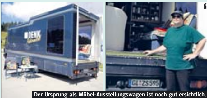
Der Ursprung als Möbel-Ausstellungswagen ist noch gut ersichtlich.

Wir fahren damit oft in den Urlaub, vorwiegend in Deutschland, wo wir uns nach dem ADAC-Stellplatzführer richten. Einmal waren wir auch in Tschechien.»