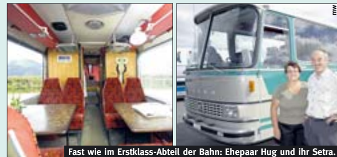
Fast wie im Erstklass-Abteil der Bahn: Ehepaar Hug und ihr Setra.

Nun möchte ich den Bus verkaufen, weil unsere Kinder erwachsen sind und nicht mehr mitreisen. Ich suche etwas Kleineres – natürlich wieder zum Ausbauen.»