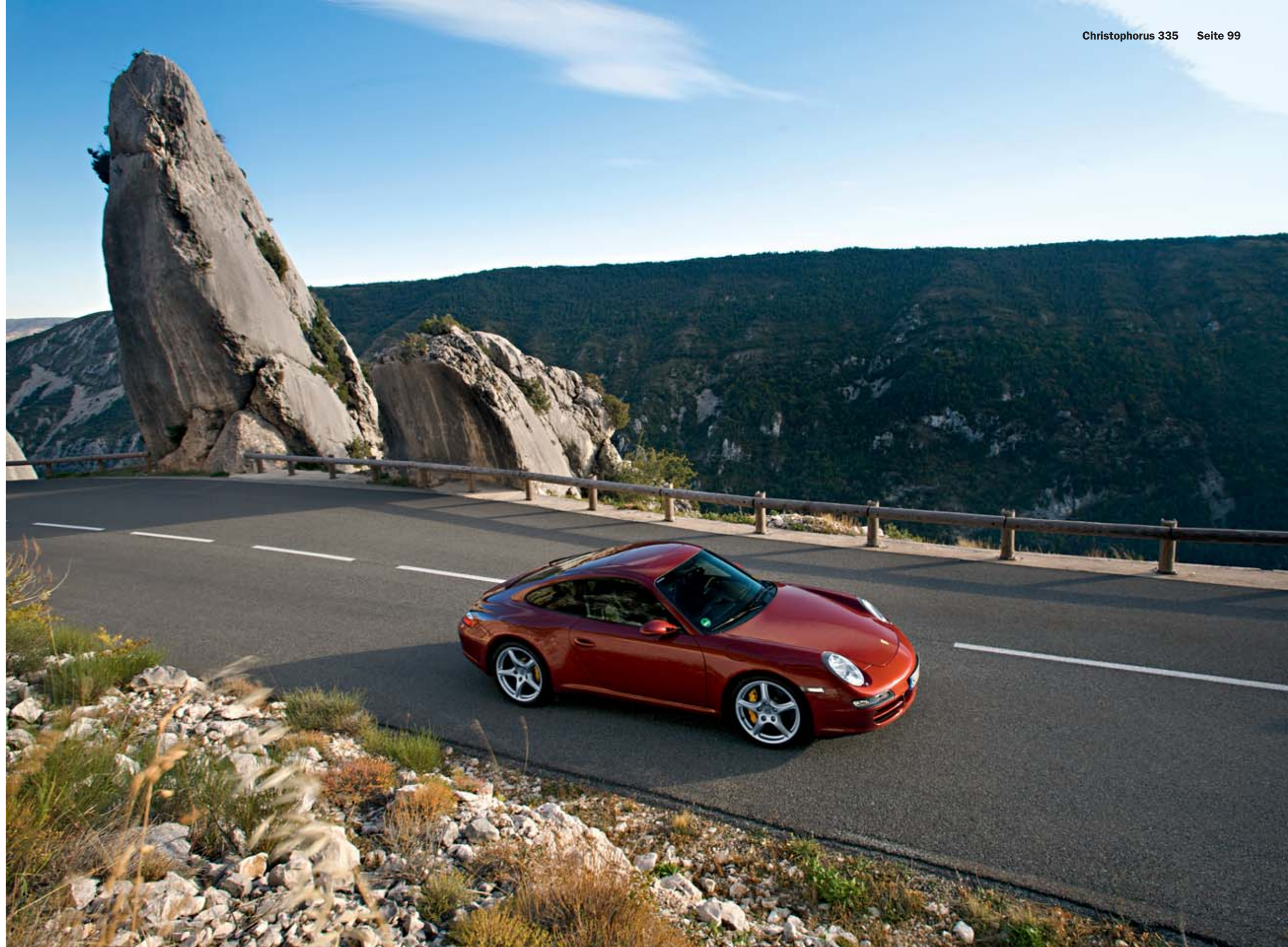
Über alle Berge: Im 911 Carrera 4S auf großer Fahrt durch das zerklüftete Hinterland der Côte d'Azur

Am nächsten Morgen rollen neue Hauptdarsteller heran: ein Schwarm von Elfern fährt aus der Tiefgarage des Hôtel de Paris und steht nun in Formation vor dem Casino. Da rückt selbst der betagte Monegasse, der auf einer Bank im Schatten eben noch ▶