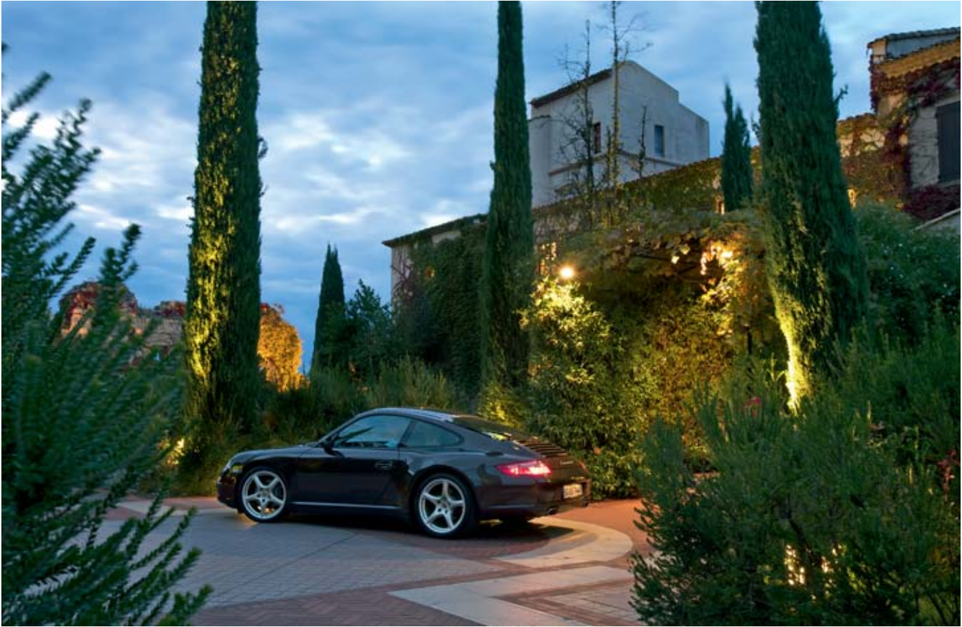
Durchatmen: Das Hotel Le Château du Domaine St. Martin unweit von Vence lädt zum Verweilen ein

1970 gelang Porsche drei Mal hintereinander ein Doppelsieg bei diesem legendären Rennen – ein bis dahin nicht für möglich gehaltener Meilenstein.